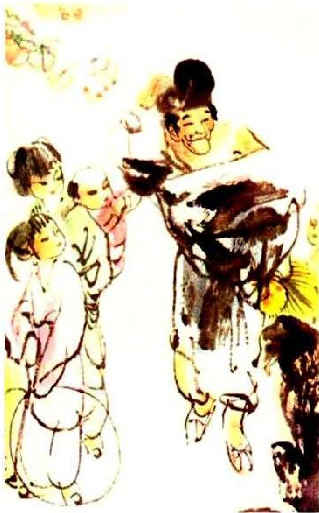
(9) 全村百来户人家，济颠挨家挨户地去劝说。他嘴唇破了，舌根讲燥了，可就是没有一家信他的话。