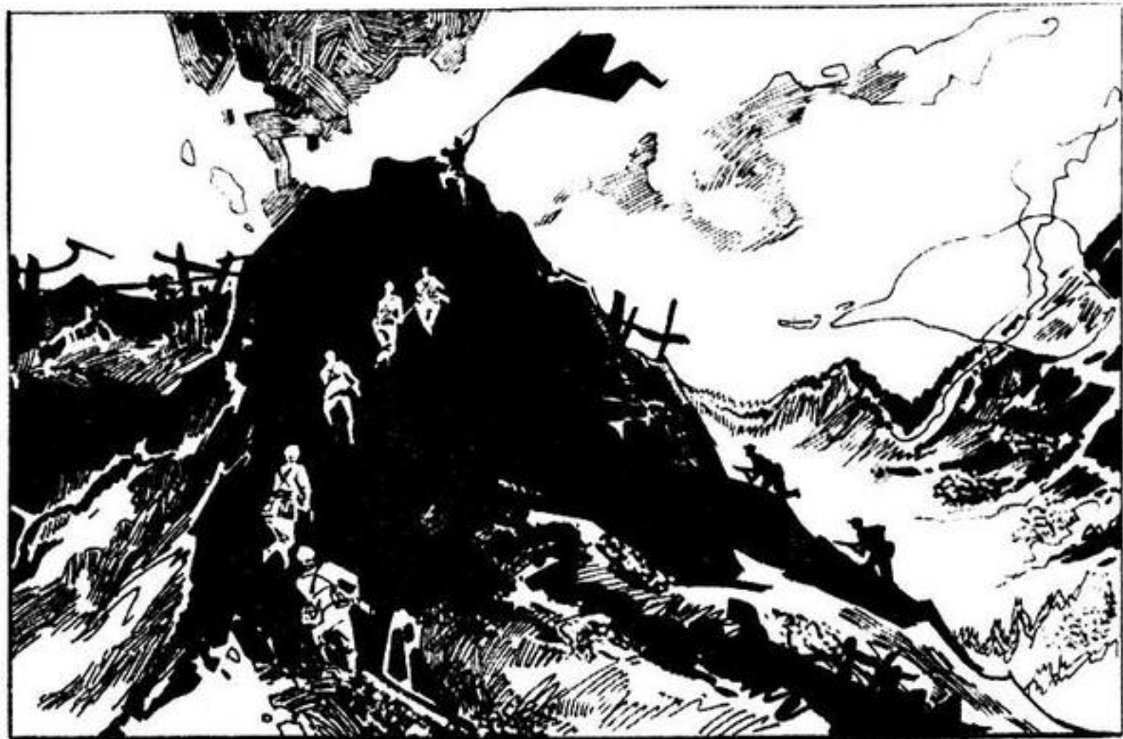
84. 鲜艳的红旗在高地上迎风飘扬。