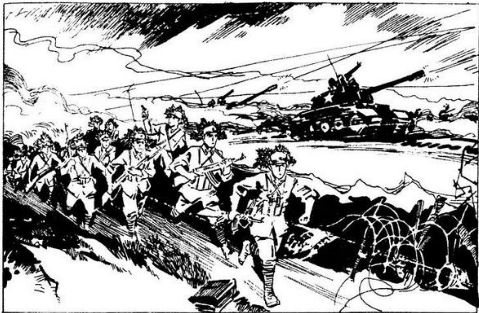
56. 广西边防部队某团二十连指战员在炮火的掩护下，以锐不可当之势，直扑越寇据守的五四二高地。